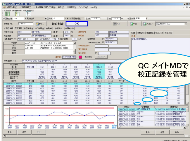
「QCメイトMD」のデータ入力画面